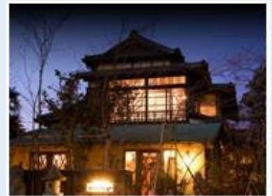
民家をそのまま骨董店として使っ た「五体投地」。お庭も素敵です。