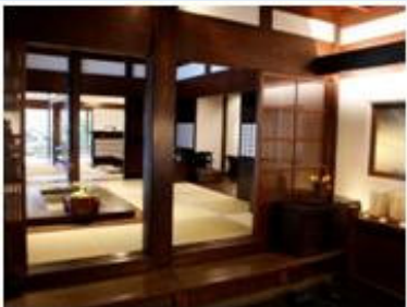
豆腐屋さんをベースにおしゃれな 居酒屋を展開する「市ノ坐」。