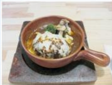
「鐵(くろがね)」の名物料理は ハンバーグシチュー。濃厚です。