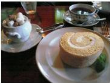
予約しないと買えない 「B-Speak」のロールケーキ。

最近新しいお店がどんどん増えて、いったいどこを紹介したらいいのか迷ってしまいます。昔から愛好していたのは、旅館「無量塔」の「茶寮柴扉洞」だったのですが、昨年オーナーが亡くなってからは宿泊客だけへの食事提供になってしまいました。それでも、系列のロールケーキ店「B-Speak」(0977-28-2166)や蕎麦の「不生庵」(0977-85-2100)、喫茶の「Tan's Bar」(0977-84-5000)などは健在なので、今もよく利用します。最近できた豆腐居酒屋(?)「市ノ坐」(0977-28-8113)も素敵なインテリアが建築家好みではないでしょうか。美味しい和牛やハンバーグを手頃なお値段で出してくれる「鐵(くろがね)」(0977-85-2299)も結構お勧めです。最後に、骨董品の名店を。仏教用語を店名にした「五体投地」(0977-85-4890)は古い民家にゆったりとアンティークの商品を展示したお店です。インテリアに興味のある方は是非足を運んでみてください。