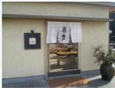
蕎麦の旨さがじっくり味わえる 無量塔の系列店「不生庵」。