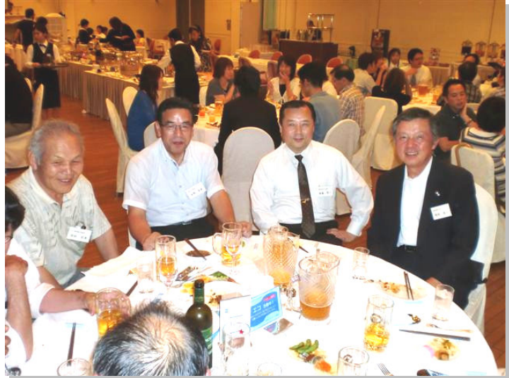
写真は談笑の一場面

会員相互の親睦を深めること、横のつながりを大切にしていくことが重要だと納涼会を通じて感じました。