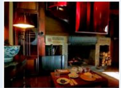
巨大なホーンスピーカーが鎮座 する癒しの空間「tan's bar」。